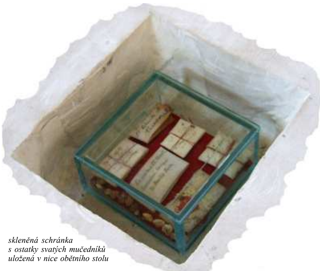
skleněná schránka s ostatky svatých mučedníků uložená v nice obětního stolu

mají podobu malé obdélné schránky, zabalené v papírovém obalu. Je jich několik a původně byly umístěny uprostřed čtvercových mramorových nebo dřevěných desek, které byly uloženy pod mensami třech bočních oltářů. Za latinským nápisem Ex ossibus (což znamená z ostatků) jsou na obalech uvedena jména mučedníků nebo světců, kterým patří. Jejich pravost potvrzuje někde zachovalá pečeť olomouckého arcibiskupství, což dokládá, že větší-